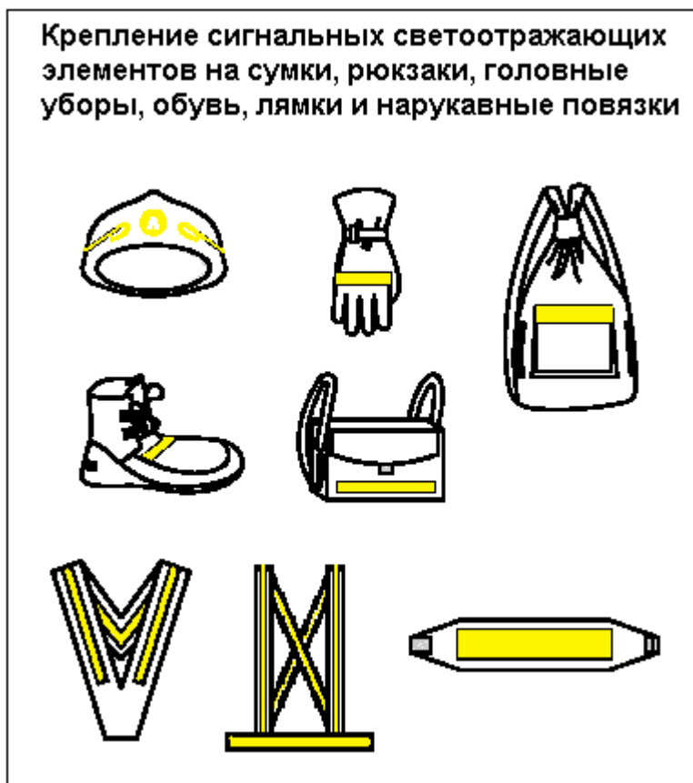
Рис.2. Крепление сигнальных светоотражающих элементов на сумки, рюкзаки, головные уборы, обувь, лямки и нарукавные повязки.