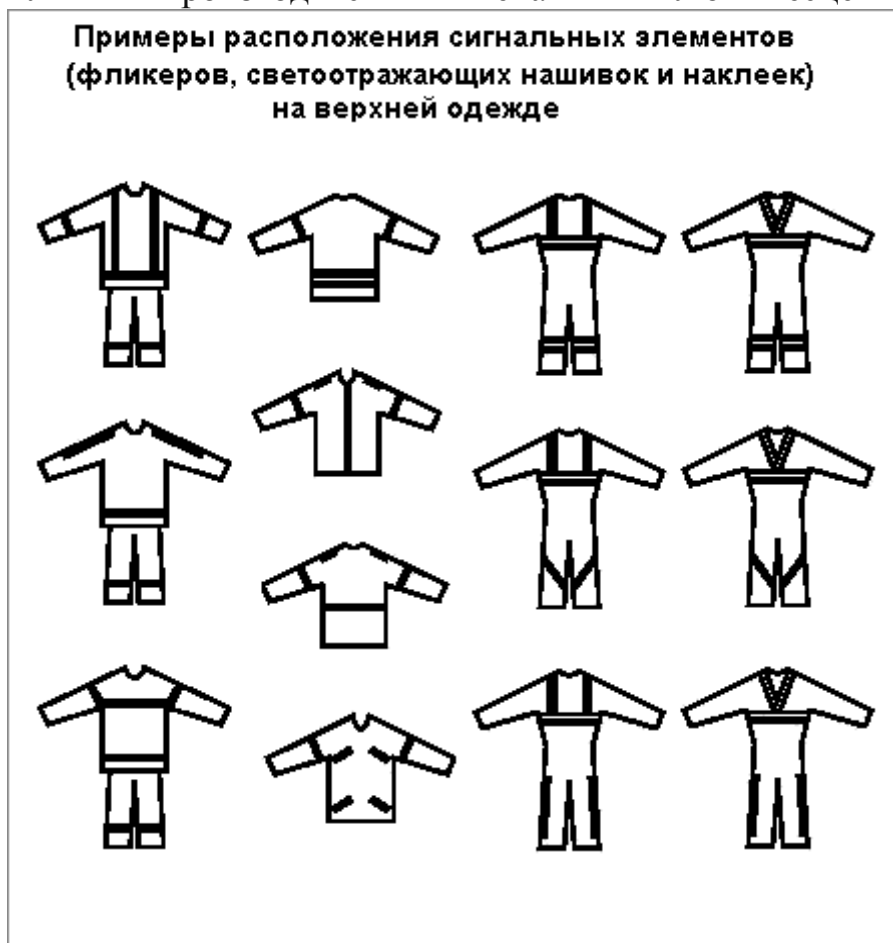
Рис.1. Примеры расположения сигнальных элементов (фликеров, светоотражающих нашивок и наклеек / лайтскотча) на верхней одежде.

из подручных материалов, например, белый лист обычной писчей или глянцевой бумаги, поднятый повыше (чтобы было видно с любой стороны), сумка поярче или цветастый целофановый пакет, посветлее. При наличии и возможности, на сигнальные поверхности, заранее наносится световозвращающая краска-спрей (из баллончиков), самоклеющаяся плёнка или производится печать люминесцентным красителем.